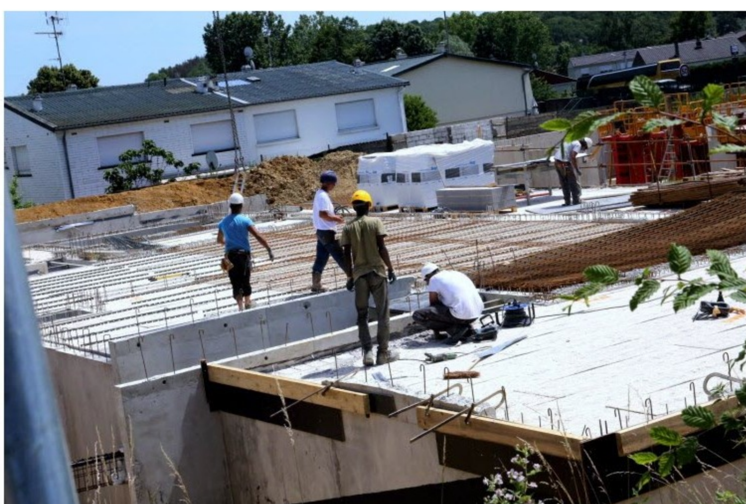
Dans le secteur du BTP, les arnaques sont légion..