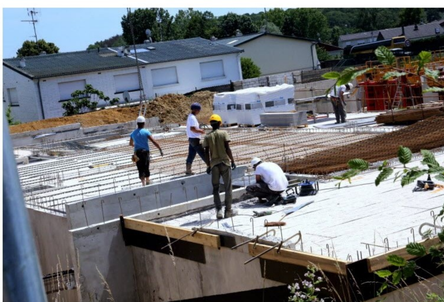
Dans le secteur du BTP, les arnaques sont légion..

Que ce soit pour des travaux d'isolation, de plomberie ou de peinture, on compte souvent sur le bouche-à-oreille pour choisir un bon professionnel ou, à l'inverse, éviter quelqu'un qu'on nous a déconseillé.